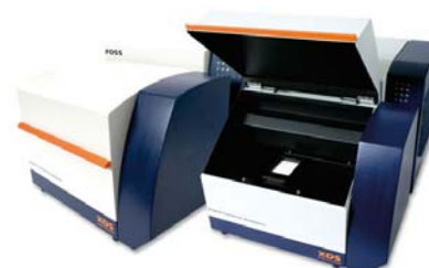
Figuur 4 Voorbeeld van een NIR apparaat

Het systeem is kostbaar en is er laboratorium kennis noodzakelijk om de analyse uit te voeren.