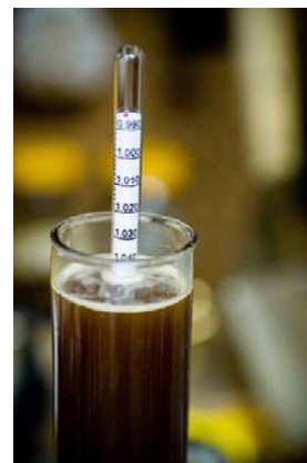
Figuur 3 Voorbeeld hydrometer

Met een afwijking van 10% tot 17% is de hydrometer niet betrouwbaar voor plaatselijke bemesting. Tevens is de hydrometer tot nu toe het meest geschikt voor alleen varkensmest en wordt N-mineraal (NH 4 -H) niet meegenomen ( www.farms.com , 2011).