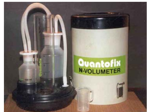
Figuur 1 Quantofix analysest

De Quantofix is een snelle analysemethode voor Ammonium. De gehele analyse duurt slechts 15 minuten. N-organisch kan vervolgens bepaald worden aan de hand van forfaitaire verhoudingen. Het is een gemakkelijk hanteerbaar en bedienbaar apparaat. De investering voor een dergelijke analysemethode bestaat uit €316,- voor het apparaat en €0,67 per test. De afwijking met analyses uitgevoerd in een laboratorium is ongeveer 4% (Van Geel, 2004).