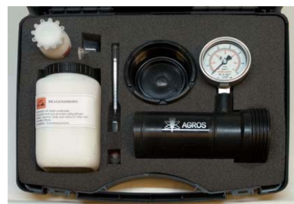
Figuur 2 Agros analyseset

Bij de Agros meter wordt geen rekening gehouden met de fosfaat behoefte en de wettelijke voorschriften ten aanzien van fosfaat bemesting (Farmwest, 2010 & Agros, 2010).