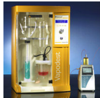
Figuur 5 Vapodest analyseapparatuur

Door de vele mogelijkheden en de technische vergelijkbaarheid naar de laboratoriumtechnieken is deze methode vrij kostbaar. Tevens is nog niet bekend of de Vapodest beschikbaar is tegen de condities van on-site (Gerhardt, 2010).