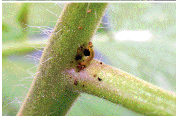
Boven: volwassen tomatenmineermotten. Onder: larve van de mineermot in een jong stadium.