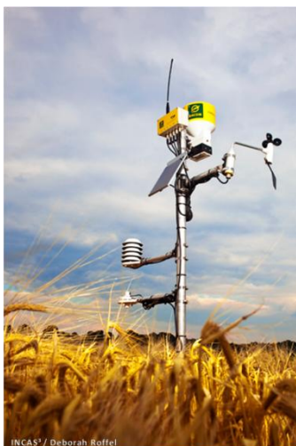
Figuur 2: Dacom weerstation

Jacob van den Borne heeft voor de bepaling van zijn Vegetatie Index (NDVI) in het groeiseizoen 2010 een aantal vooraf bepaalde percelen meerdere keren (sommige percelen 4 maal, en één perceel 20 maal) gescand met de Greenseeker 1 . Dacom heeft op locatie weerstations geïnstalleerd die gedurende het groeiseizoen het BOS systeem hebben voorzien van actuele klimaatgegevens.