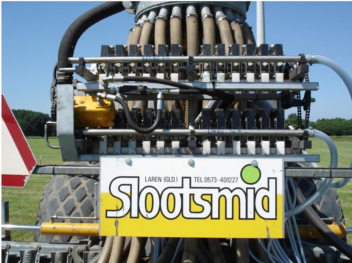
Figuur 3. Slangenpomp achterop de mestmachine voor de dosering van vloeibare kunstmest